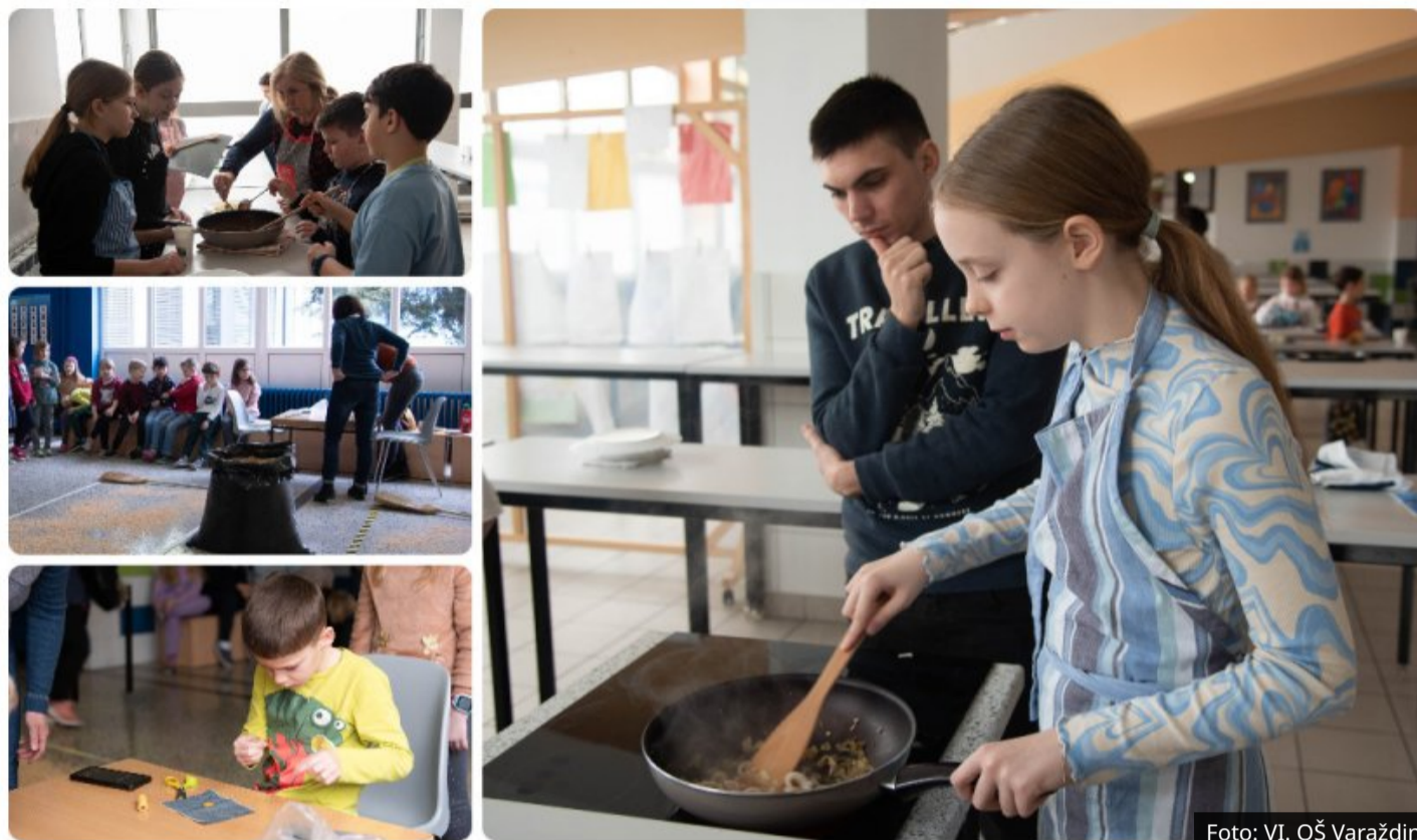
FOTO U VI. OŠ održan 11. "Zdravi tjedan", ovog puta pripremala se riba!

👤 WV | 🕒 3.3.2023. u 19:53h | Objavljeno u Društvo