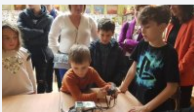
FOTO VI. OŠ Varaždin proslavila 55. rođendan uz "Moj dan u školi"