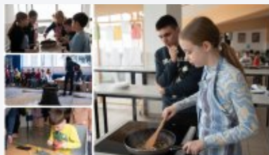
FOTO U VI. OŠ održan 11. "Zdravi tjedan", ovog puta pripremala se riba!